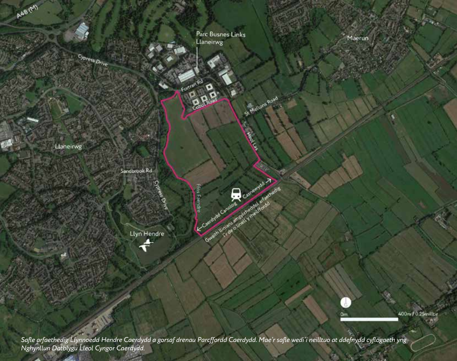
Safle arfaethedig Llynnoedd Hendre Caerdydd a gorsaf drenau Parcfordd Caerdydd. Mae'r safle wedi'i neilltuo at ddefnydd cyflogaeth yng Nghynllun Datblygu Lleol Cyngor Caerdydd.