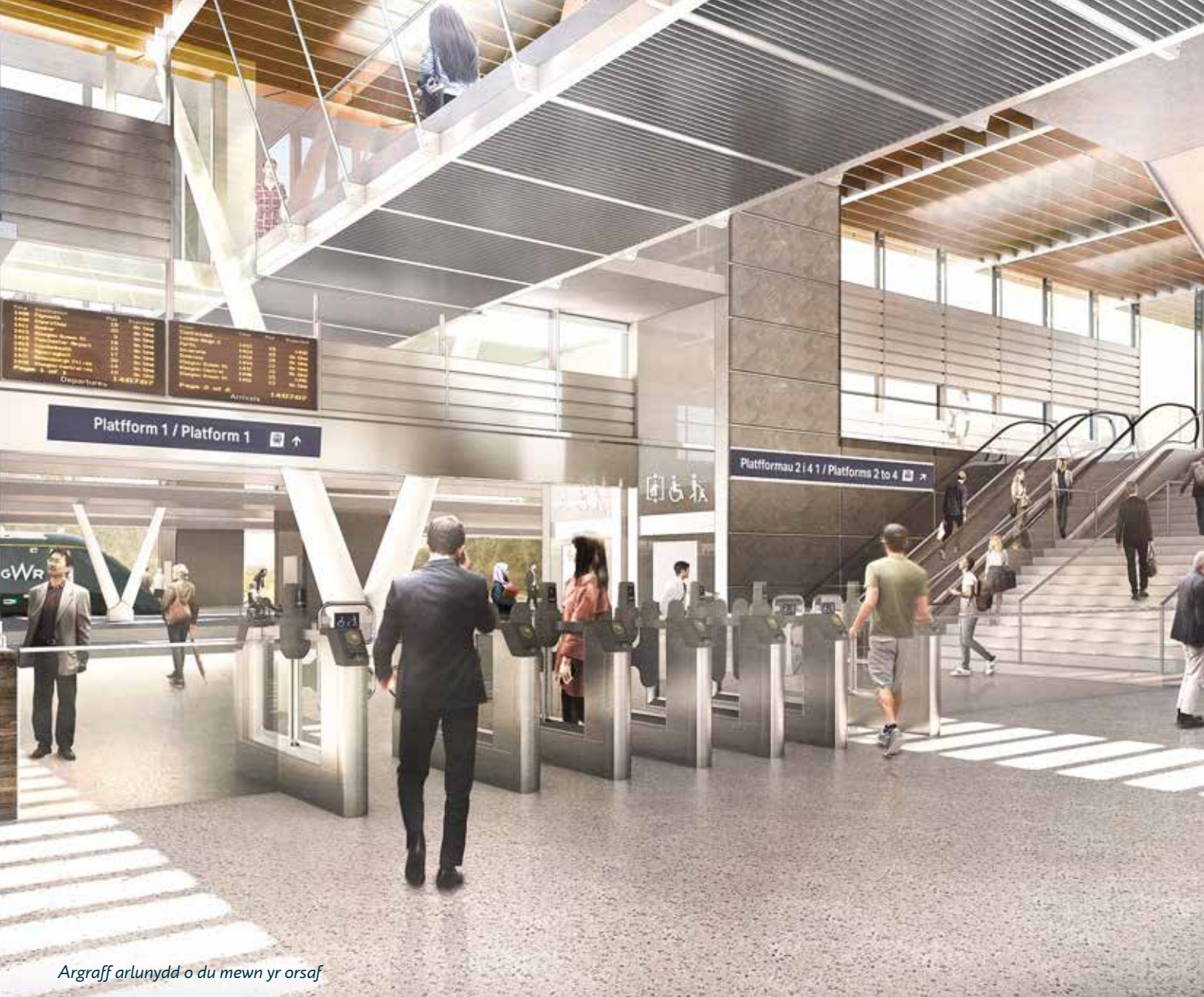
Argraff arlunydd o du mewn yr orsaf