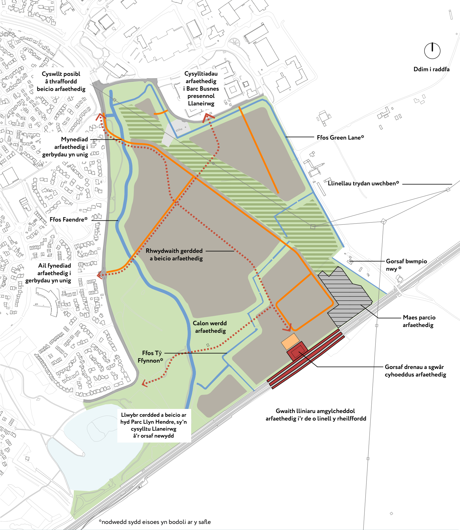
Cynllun o'r safle sy'n nodi rhai o nodweddion allweddol datblygiad arfaethedig Llynnoedd Hendre.